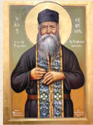
Ἔργο κ. Κωνστ. Δημητρέλου

Διηγείται ὁ μητροπολίτης Μόρφου τῆς Κύπρου Νεόφυτος: Ἐνα πολύ σημαντικό περιστατικό πού θυμοῦμαι ἀπό τόν Γέροντα Εὐμένιο εἶναι μιὰ προσευχή πού ἔκανε: «Κύριε Ἰησοῦ Χριστέ, θέλω νά σώσεις ὅλους τούς ἀνθρώπους». «Κι ἐχάρη ὁ Θεός», μοῦ ἔλεγε. «Καί μετὰ εἶπα: «Κύριε Ἰησοῦ Χριστέ, θέλω νά σώσεις ὅλους τούς καθολικούς. Καί ὅλους τούς προτεστάντες, Χριστέ μου, θέλω νά σώσεις». Κι ἐχάρη ὁ Θεός. «Θέλω νά σώσεις καί τούς μουσουλμάνους καί ὅσους ἀνήκουν σέ ὅλες τίς θρησκείες, καί τούς ἀθέους ἀκόμα θέλω νά σώσεις». Κι ἐχάρη πολύ ὁ Θεός. Καί τοῦ εἶπα: «Χριστέ μου, θέλω νά σώσεις ὅλους τούς ἀπ' αἰῶνες κεκοιμημένους, ἀπό Ἀδάμ μέχρι τώρα». Κι ἐχάρη ὁ Θεός πολύ. Καί εἶπα: «Θεέ μου, θέλω νά σώσεις καί τόν Ἰούδα». Καί στό τέλος εἶπα: «Θέλω νά σώσεις καί τόν διάβολο». Κι ἐλυπήθη ὁ Θεός». Τοῦ λέω: «Γιατί λυπήθηκε ὁ Θεός;». «Διότι θέλει ὁ Θεός καί δέν θέλουν αὐτοί», μοῦ ἀπάντησε, «δέν ὑπάρχει ἴχνος καλῆς θελήσεως σωτηρίας στόν διάβολο». «Καλά», τοῦ εἶπα, «πῶς κατάλαβες ἐσύ πότε ὁ Θεός χαιρόταν καί πότε ἐλυπήθη;». Καί μοῦ λέει: «Ἄμα ἡ καρδιά σου γίνε ἕνα μέ τήν καρδιά τοῦ Χριστοῦ, αἰσθάνεσαι αὐτά πού αἰσθάνεται». Δηλαδή ἀντιλαμβάνεσαι τί εὔρος εἶχεν ἡ καρδιά αὐτοῦ τοῦ ἀνθρώπου; Αὐτό εἶναι ἀπό τά πιό δυνατά πού ἔχω ἀκούσει καί δέν τό ἔχω ἀκούσει ἀπό κανέναν ἄλλον. Κι αὐτό τό καταλάβαινε ἀπό τήν ἔνταση τῆς Χάριτος. Ἀνάλογα μέ τόν βαθμό τῆς Χάριτος ἀντιλαμβάνονταν τή λύπη ἢ τή χαρά Του, σ' αὐτό πού ὁ ἴδιος ἔλεγε ἢ ἔκανε.