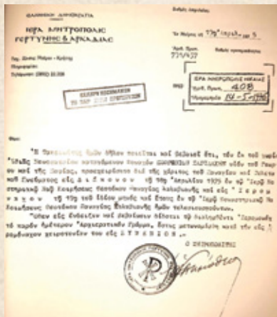
Χειροτονητήριο γράμμα ὑπό τοῦ Μητρ. Γορτύνης καί Ἀρκαδίας καί μετέπειτα Ἀρχιεπισκόπου Κρήτης Τιμόθεου (Σίμωνος Μοναχοῦ, 2011, σσ. 457)