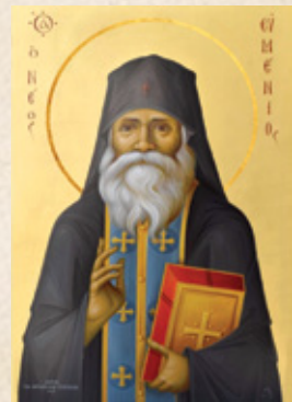
Ἔργο κ. Στεφ. Ἀλμπαντάκη

Μέσα στό ἔτος 2005 ἓνα ἀπόγευμα ἐπισκέφθηκαν τή Μονή Κουδουμᾶ μιᾶ κοπέλα μέ τόν πατέρα της ἀπό τή Λάρισα, ζητώντας νά προσκυνήσουν τόν Ναό τῆς Παναγίας. Εἰσερχόμενη στόν Ναό ἡ κοπέλα δέν μπορούσε νά προσκυνήσει, διότι κάτι τήν ἐμπόδιζε. Ὁ πατέρας ἐξήγησε στόν Ἡγούμενο ὅτι ἡ κόρη του ἔπασχε ἀπό δαιμονική ἐπήρεια καί τῆς ἐνεφανίσθη πρό καιροῦ ὁ Μακαριστός Γέροντας Εὐμένιος ἀπό τό χωριό τῆς Κρήτης Ἐθιά (δέν εἶχαν ἀκούσει ποτέ γι' αὐτόν) καί τήν προέτρεψε ἐπίμονα νά ἔρθῃ στόν τάφο του καί ἐκεῖνος θά τή θεραπεύσει, διότι, ὅπως τῆς εἶπε, ἐκεῖνος εἶχε ταλαιπωρηθεῖ τό ἴδιο ἀπό τά δαιμόνια, «μόνο πού ἐγώ τό ἔπαθα ἀπό τήν ὑπερηφάνεια, ἐνῶ ἐσύ ἀπό βλασφημία». Ἔτσι ἦρθαμε σήμερα στήν Κρήτη καί πήγαμε στόν τάφο τοῦ Γέροντα καί ἐνῶ προσκυνήσαμε, ἡ κόρη μου ἄκουσε τή φωνή τοῦ Γέροντα νά τῆς λέει: «Νά πᾶς εἰς τή Μονή τοῦ Κουδουμᾶ νά ζητήσεις ἀπό τόν Ἡγούμενο νά σέ σταυρώσει καί θά γίνεις καλά».