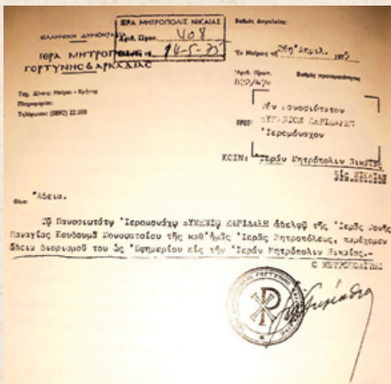
Ἀπολυτήριο τῆς Ἱεράς Μητροπόλεως Γορτύνης καί Ἀρκαδίας, γιά διορισμό στή Μητρόπολη Νικαίας (Σίμωνος Μοναχοῦ, 2011, σσ. 458)