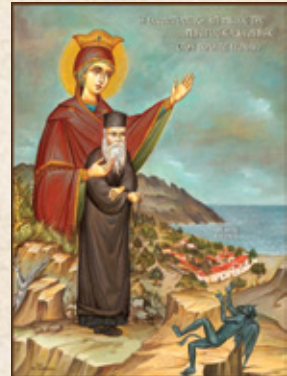
Ἔργο κ. Γαλανόπουλου

Αὐτό τό καθοριστικῆς σημασίας γεγονός γιά τή ζωή τοῦ Σωφρονίου συνετέλεσε, κατά τή μαρτυρία τῶν μακαριστῶν γερόντων Ἀναστασίου Λεονταρίδη καί Εὐμενίου Λυκάκη, νά παραμείνει ἀρκετό διάστημα στή Μονή Κουδουμᾶ καί στό νά ἐγγραφεῖ στό μοναχολόγιό της. Μάλιστα, κατά μαρτυρία τοῦ πρώτου, συνασκήθηκαν στίς σπηλιές τοῦ Κουδουμᾶ γιά λίγο διάστημα, πράγμα πού ἄρεσε πολύ στόν π. Εὐμένιο ἀλλά