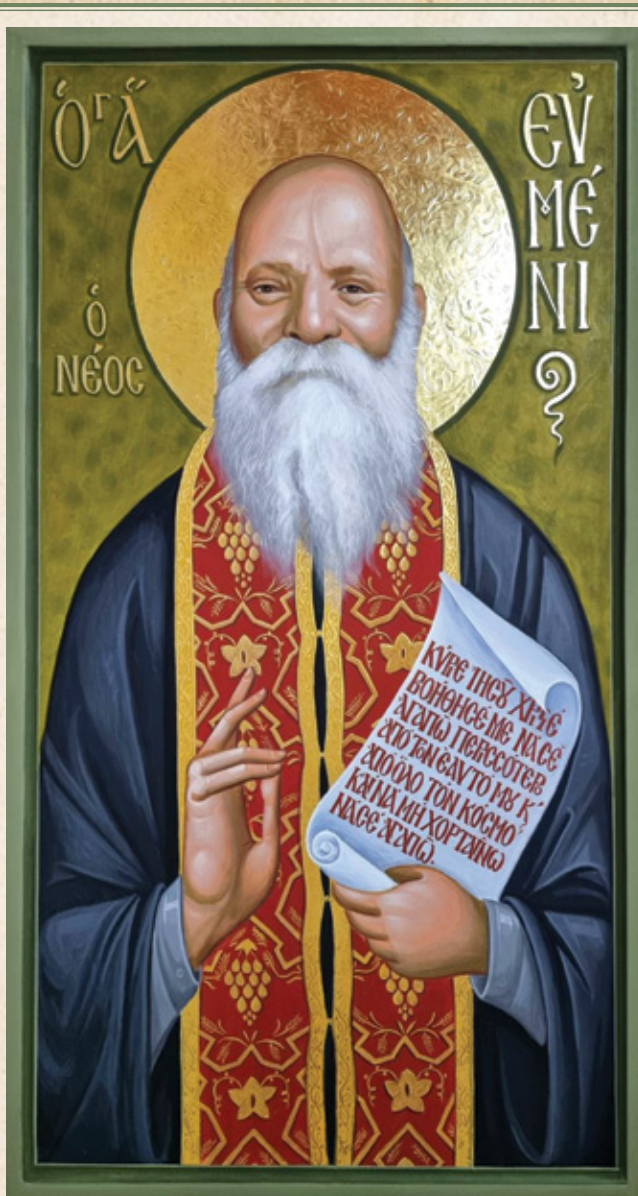
Έργο άγιογραφίου τής Ι. Μονής