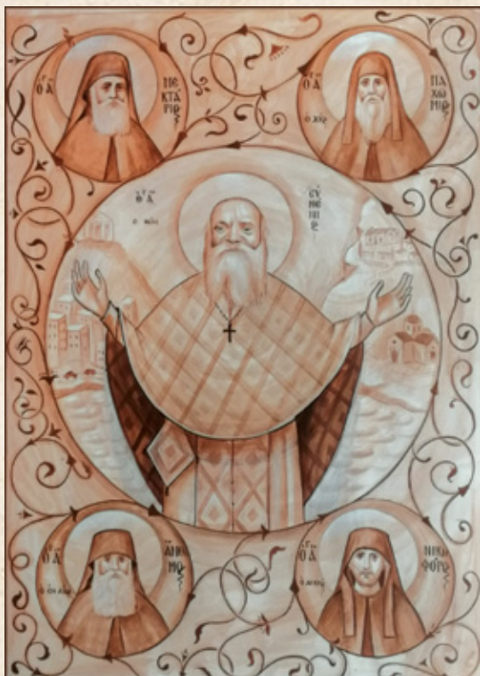
Ἔργο ἀγιογραφίου τῆς Ι. Μονῆς